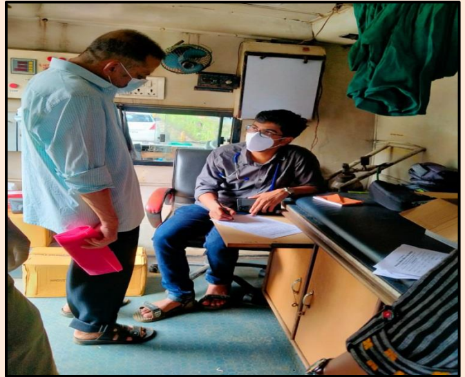
Antigen Test & Patient Check-up