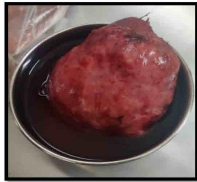
कॅन्सरच्या थायरोईडच्या गाठीचा नमुना